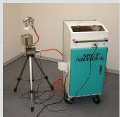
シャットノクサス®SNA