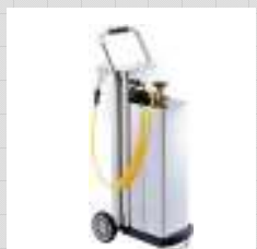
シャットノクサス®ミニ