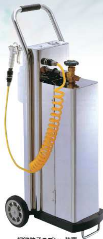
超微粒子スプレー装置 シャットノクス・ミニ

電源のない場所でも、引火性のアルコール製剤でも、様々な薬剤でも、微粒子スプレー可能です。